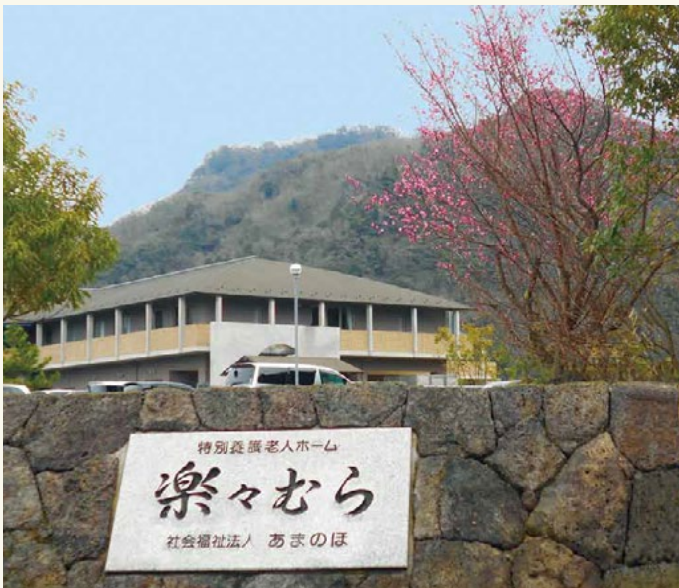
春の息吹を感じる「楽々むら」