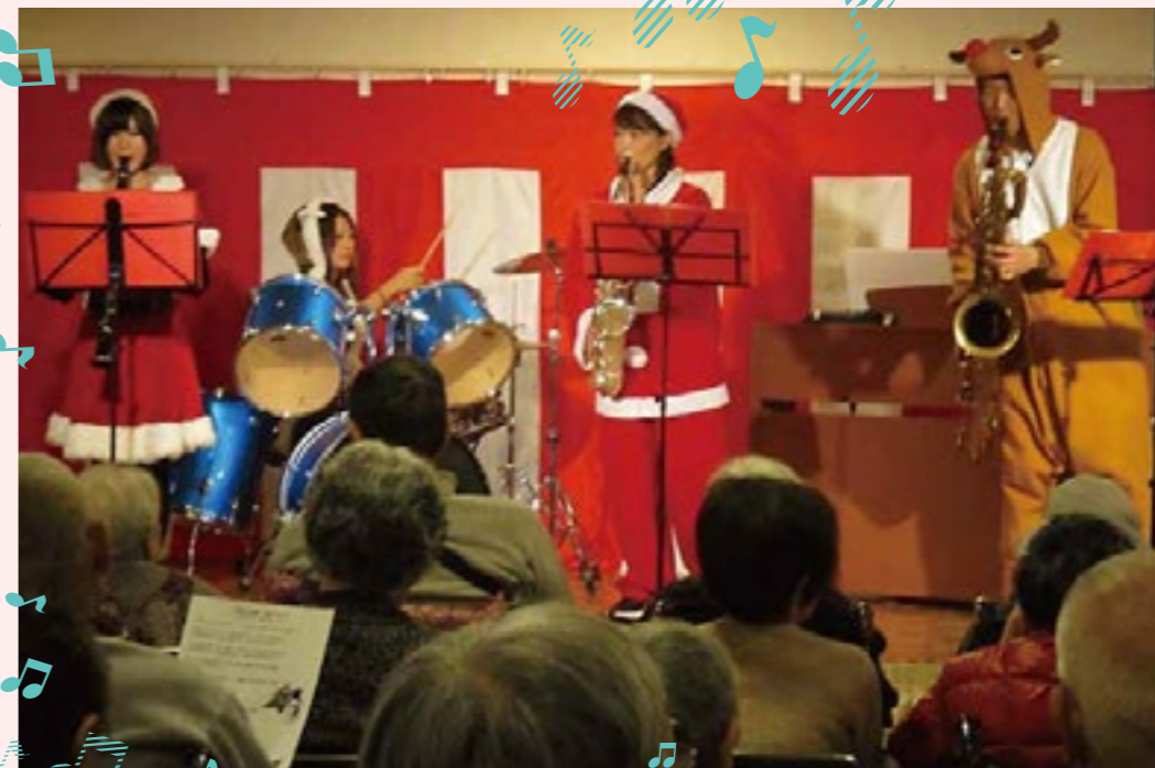
職員による演奏会

楽々むらは平成27年12月20日で満9歳。 利用者の皆様と楽しくお祝いをしました。