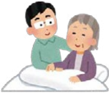
理学療法士により ベッドの上での安楽姿勢について 学ぶ様子 (平成27年12月15日)